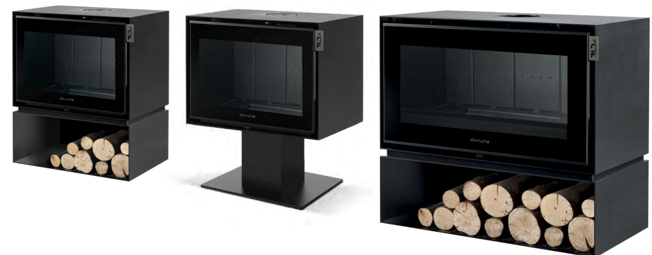
MONTMARTRE 800C FR9011040B EAN: 3760075412036