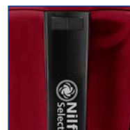
VARIATEUR DE PUISSANCE