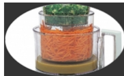
3 cuves en 1